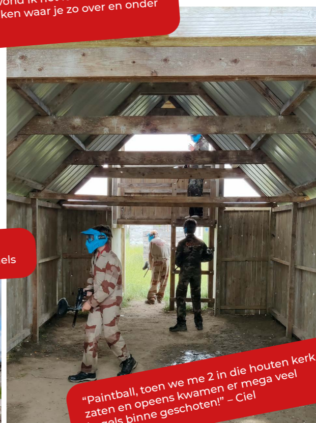
"Paintball, toen we me 2 in die houten kerk zaten en opeens kwamen er mega veel kogels binne geschoten!" – Ciel