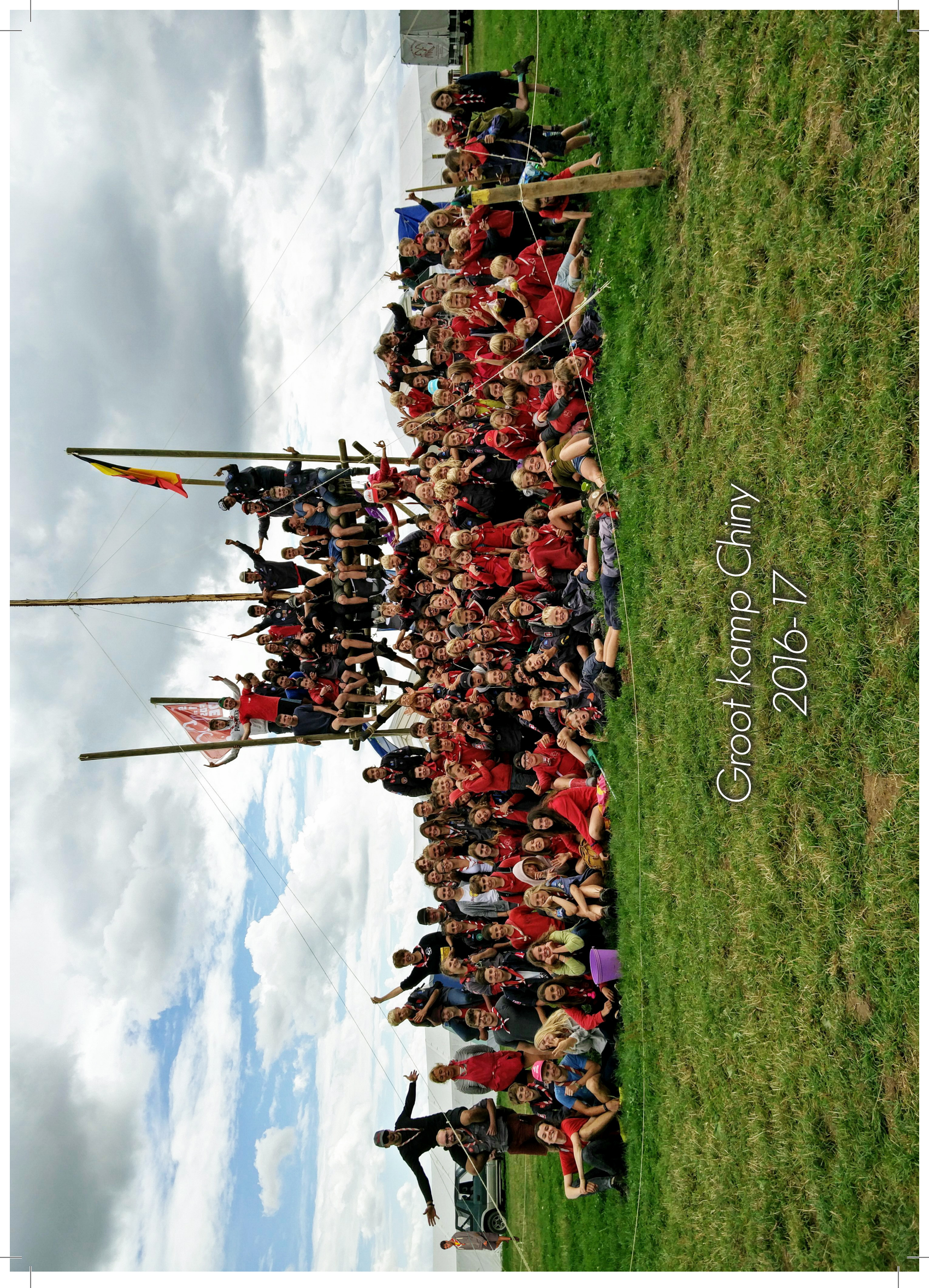
Groot kamp Chiny 2016-17