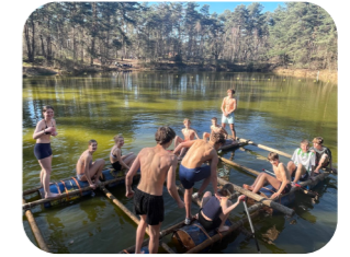
Uiteindelijk loopt alles altijd vlot af